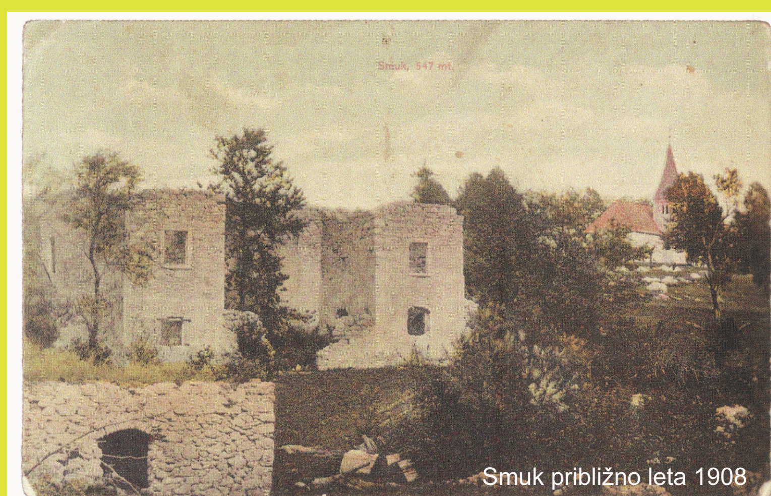
Smuk približno leta 1908